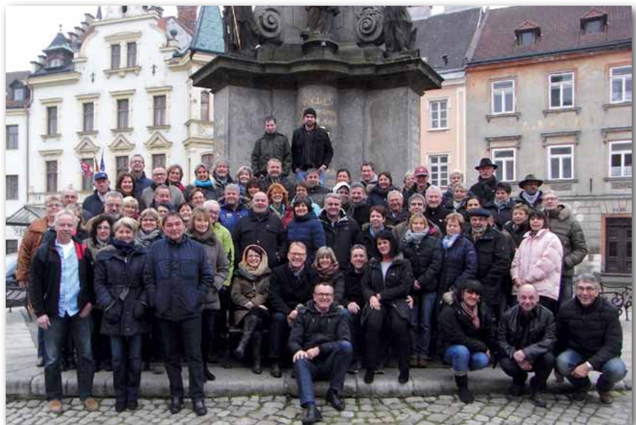
Unsere Unterfranken auf der Heimreise bei einem Zwischenstopp im romantischen Örtchen „Ellenbogen“ an der Eger.

natürlich mit dem weltbekannten Gerstensaft, in einer der ältesten Prager Bierstuben und einem Besuch des Weihnachtsmarktes war alles gegeben.