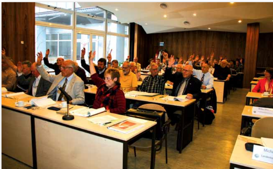
Die Delegierten der Landesseniorenkonferenz

Sie sind ein wichtiges Rädchen im Getriebe der Gewerkschaft der Polizei: die aktiven Seniorinnen und Senioren. Und so nimmt es nicht wunder, dass die 7. Landesseniorenkonferenz am 24. Oktober 2013 in Berlin unter dem bundesweiten Motto „Erfahrung gestaltet Zukunft“ stand. Auch die Bundesseniorenkonferenz 2014 soll von diesem Leitmo-