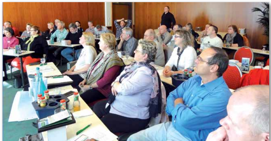
Gespannte Aufmerksamkeit der Kolleginnen und Kollegen