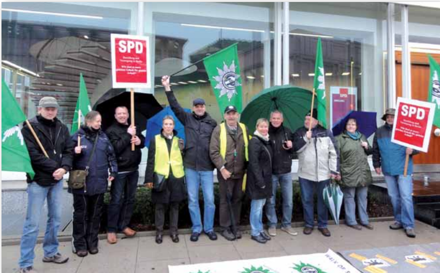
Kolleginnen und Kollegen der Bezirksgruppe LKA