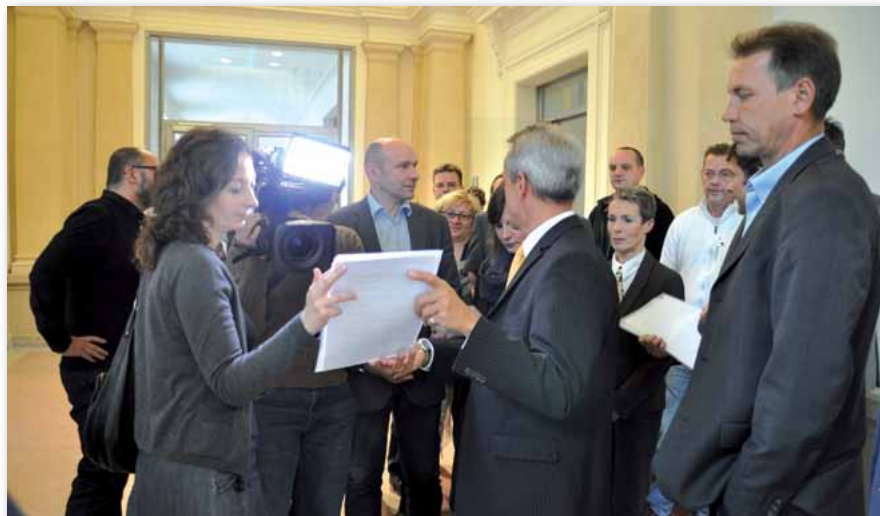
Neben den Oppositionsparteien zeigten auch die Medien Interesse an der Resolution zur Beamtenbesoldung.