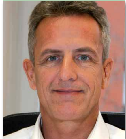
Michael Purper, GdP-Landesbezirksvorsitzender

Liebe Kolleginnen und Kollegen, kaum zu glauben, aber wahr. Wir gehen schon wieder mit großen Schritten auf Weihnachten und den Jahreswechsel 2013/14 zu. Grund genug für mich, diese letzte DP-Ausgabe in 2013 zu nutzen, um