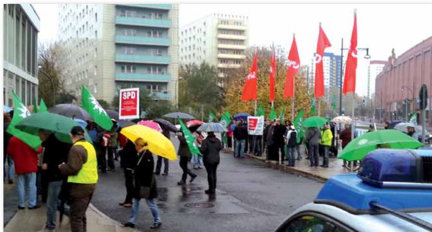
Trotz schlechten Wetters zeigt die GdP reichlich Flagge vor dem SPD-Parteitag.

– Flugblätter und Proteste begleiten den SPD-Landesparteitag –