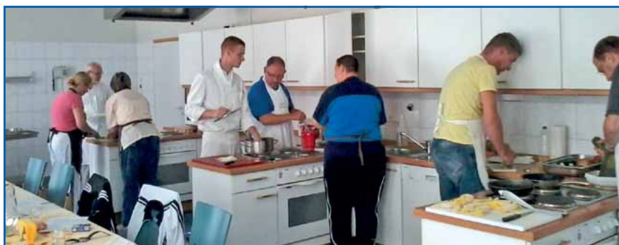
Schnellkurs in gesunder Ernährung :-)

Die Teilnehmer sollten die Verpflichtung eingehen, für sich etwas tun zu wollen, die Zeit zu genießen, Arbeit sein zu lassen und nachhaltig viel von den Erfahrungen der Kur mitzunehmen.