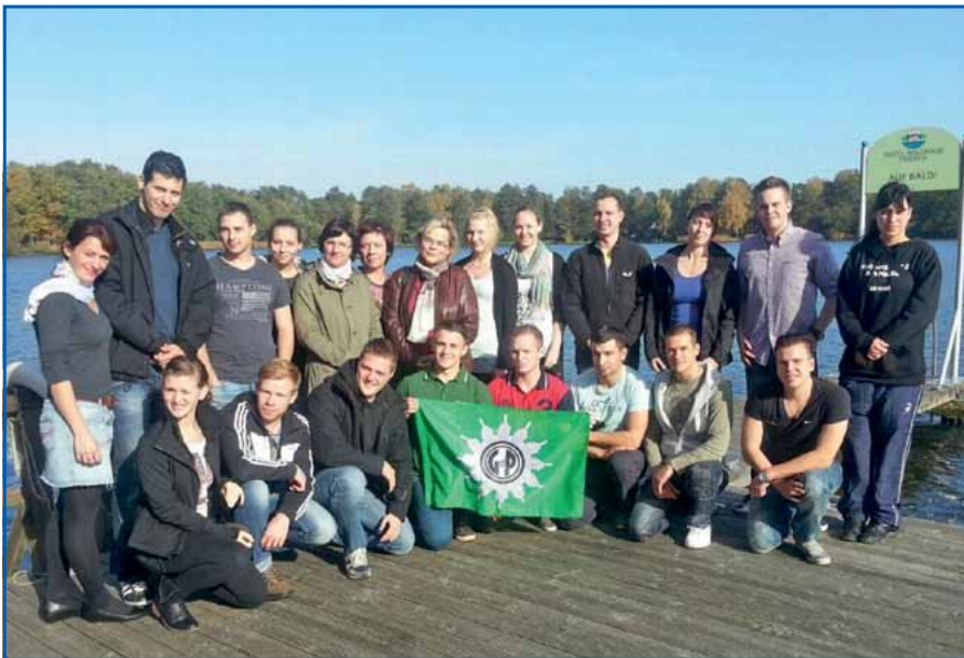
Seminar „Junge Leute“

JUNGE GRUPPE GdP Brandenburg Landesjugendvorstand