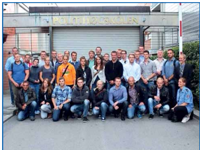
Unsere Truppe vor der Fachhochschule der Polizei in Oslo.

schule. Ein ehemaliger Polizist und heutiger Dozent der FH hielt für uns einen Vortrag über den Polizeiberuf in Norwegen. Er erklärte uns, dass es in Norwegen lediglich vier Polizeischulen gibt und dass die Anwarter während der drei Jahre Stu-