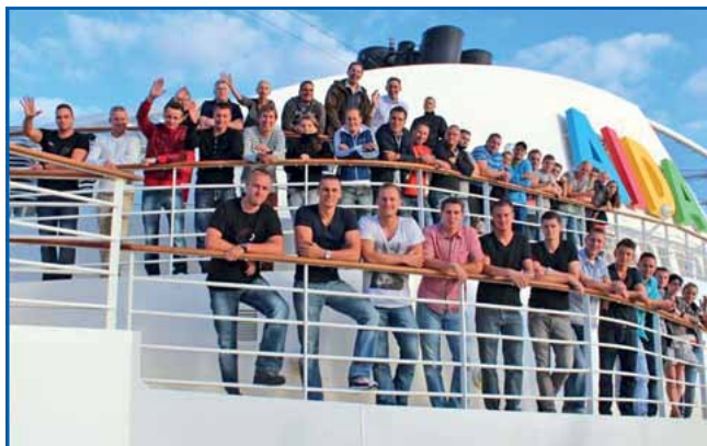
Ablegen in Kopenhagen

lungsverfahren gibt es ähnliche Testbereiche wie bei der deutschen Polizei. Jedoch wird am Ende nach dem Abiturdurchschnitt eingestellt. Hierbei wird darauf geachtet, dass die Frauenquote bei ca. 40% und die Immigrantenquote bei 5% liegen. Weiterhin berichtete er, dass Polizisten in Norwegen keine Waffen bei sich tragen. Diese sind in den Wachen oder ggf. im Funkwagen gelagert. Nach einem sehr informativen und beeindruckenden Tag legten wir am frühen Nachmittag mit unserem Schiff wieder ab und erreichten am nächsten Tag den Hafen von Kopenhagen. Dort hatten wir die Gelegenheit, einen individuellen Landgang zu unternehmen. Die Tagesgestaltung reichte von Sport an Land über Sightsee-