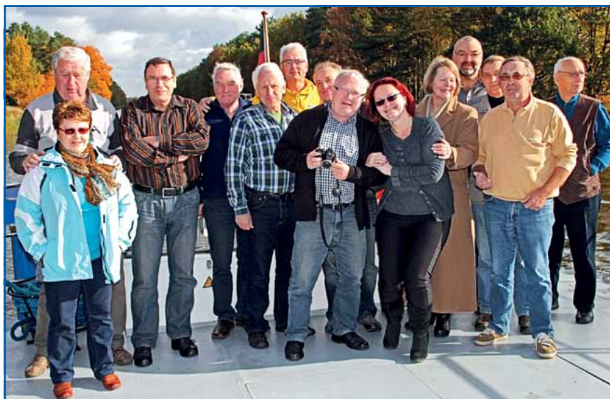
Alle Mann (und Frauen) an Deck ;-)