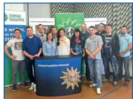
Länderübergreifende Sitzung in Rostock

Um das Thema „Zukunftsfähigkeit der JUNGEN GRUPPE GdP“ ging es bei der zentralen Arbeitstagung im Mai. Dazu kamen an die 20 junge Gewerkschafterinnen und Gewerkschafter, unter anderem aus Brandenburg, in Brakel (NRW) zusammen, um Handlungsempfehlungen, Vorstellungen, Leitlinien, Ideen usw. auszutauschen, zu erörtern, zu diskutieren und niederzuschreiben. Unter diesem Hintergrund findet mit dem Motto „Wir sind unsere Zukunft“ im April 2014 in Potsdam die Bundesjugendkonferenz statt.