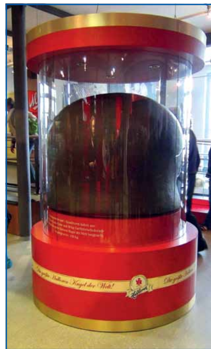
Die größte Hallorenkugel der Welt.

Angekommen im Hotel, gestärkt am reichlichen Büfett, war erneut Kraft gefordert. Beim Kegeln auf zwei Bahnen stellten wir unser „Können“ unter Beweis. Gewinner waren wir alle, den der Spaß stand im Vorder-