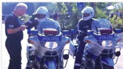
Unser Tourguide instruiert die Kollegen der Bundespolizei.

Der Gastronom des Sportvereins TSV Lütjenburg sorgte zusammen mit