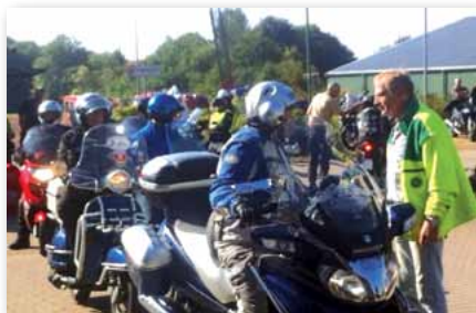
Auch Rollerfahrer waren willkommen!

Mit weit über 150 Bikern, einer großartigen Unterstützung durch viele Freunde und Helfer und ein wenig Glück mit dem Wetter wurde die Premiere des gemeinsamen Bikertreffens der GdP eine gelungene Veranstaltung. Trockene Straßen bis in die Abendstunden, angenehme Temperaturen und ein vielfältiges Angebot sorgten für eine Veranstaltung, die nach einer Wiederholung ruft.