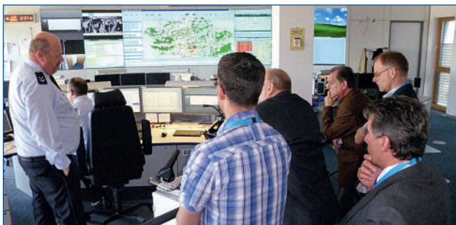
Die zentrale Leitstelle in Luxemburg.