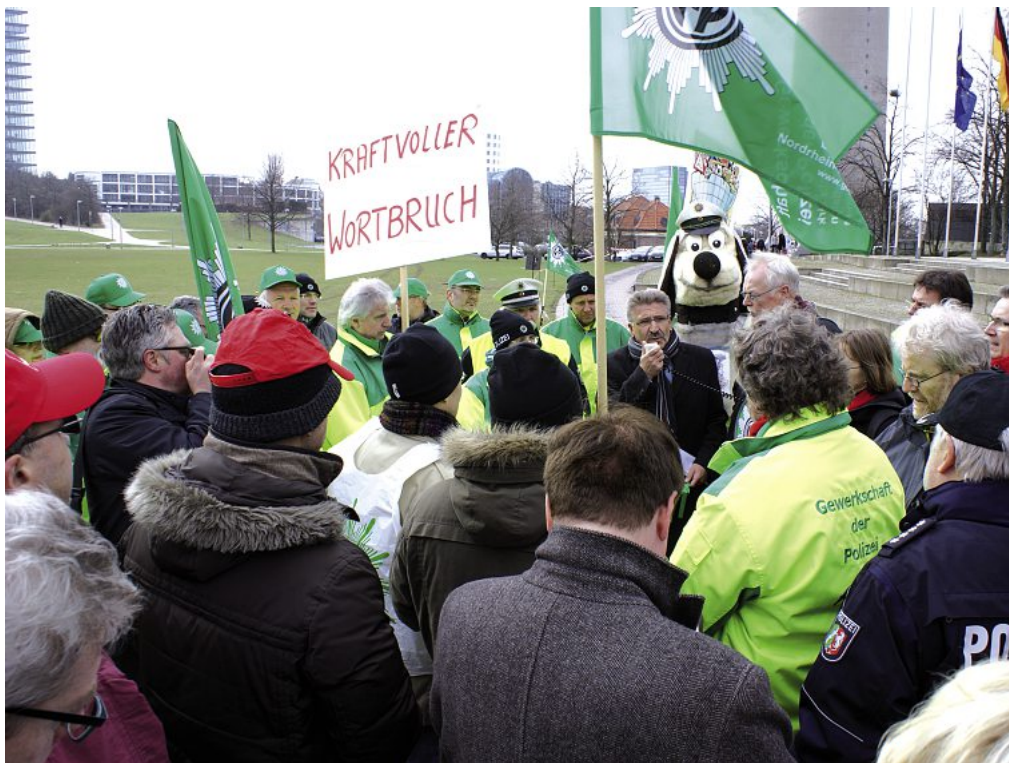
Seit dem 20. Mai protestiert die GdP mit Mahnwachen gegen den Wortbruch der Landesregierung.

Auch im Vergleich zur Privatwirtschaft ist der öffentliche Dienst immer mehr zurückgefallen. In den vergangenen zehn Jahren sind die Einkommen im öffentlichen Dienst zudem deutlich geringer gestiegen als in der Privatwirtschaft. Auch das erklärt, warum die von Rot-Grün angestoßene Neiddebatte in der Öffentlichkeit bisher nicht verfangen hat. Bei einer Umfrage der Rheinischen Post entschieden sich Mitte April auf die Frage, „Sollen Polizisten Ihrer Meinung nach mehr verdienen?“, 77 Prozent für „Ja“, nur 23 Prozent für „Nein?“.