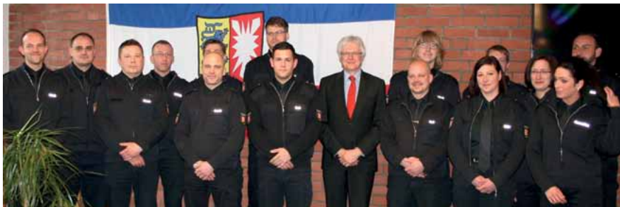
Sie schlossen ihre zweijährige Ausbildung als Justizvollzugsbeamte erfolgreich ab.

Dabei erklärte der Staatssekretär: „Der Justizvollzugsdienst unseres Landes benötigt Sie als qualifizierte und motivierte Mitarbeiterinnen und Mitarbeiter. Unser moderner Strafvollzug verfolgt im Umgang mit den Gefangenen anspruchsvolle Ziele: Nämlich die Balance zwischen dem Resozialisierungsgedanken mit dem Ziel einer erfolgreichen Wiedereingliederung in unsere Gesellschaft einerseits und dem Vollzug der Freiheitsstrafe als Sicherungsaufgabe andererseits. Ihre künftige Aufgabe ist daher gesellschaftlich wertvoll und verantwortungsvoll. Sie haben dafür eine anspruchsvolle und vielseitige Ausbildung erfolgreich absolviert.“