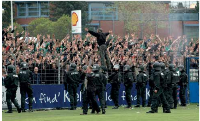
Die Anzahl der Einsätze bei Fußballspielen steigt auch in Schleswig-Holstein.

Kein Einsehen fand Börner mit seiner Forderung bei Innenminister Andreas Breitner (SPD), oberster Dienstherr der Polizei: „Der von dieser Landesregierung beschlossene Stellenabbaupfad ist ein Weg ohne Um-