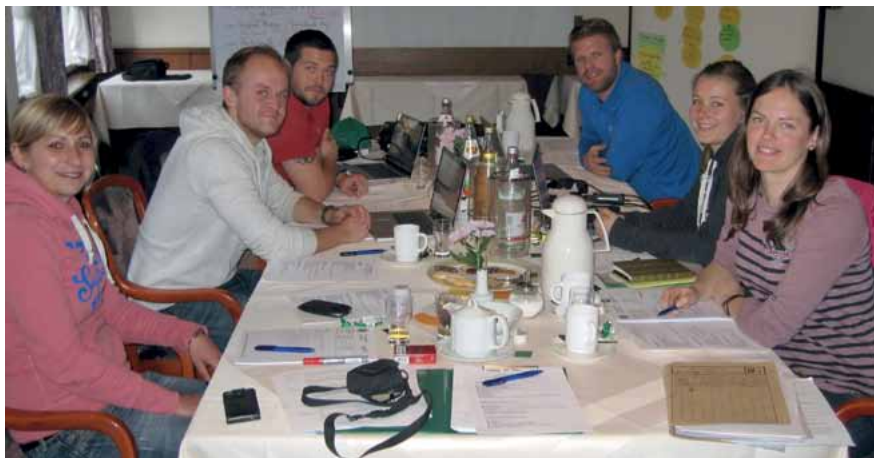
rr Der Vorstand der Jungen Gruppe bei der Arbeit.

Zu einem Seminar trafen sich junge Mitglieder der GdP Schleswig-Holstein in Soltau. Ziel war es, Grundlagen von Demokratie und Gewerkschaft zu vermitteln. Engagiert arbeiteten die Teilnehmer des Seminars mit und legten verbindlich Arbeitsschwerpunkte, Projekte und Verantwortlichkeiten fest. Als Nebenthemen wurden Gewalt gegen Polizei, Reaktionen auf Strafanzeigen wegen Dienstpflichtverletzung im Amt, aber auch der Umgang mit Besoldungsrückforderungen des Finanzverwaltungsamtes bearbeitet. Gewerkschaft und Personalrat gehören zusammen. Deshalb wurde auch ein Ausblick auf die 2015 anstehenden Personalratswahlen gemacht.