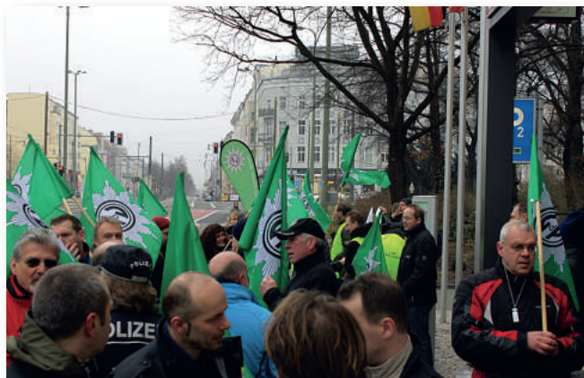
Zur Auftaktveranstaltung am 27. März 2011 kamen bereits viele Kolleginnen und Kollegen, um für die Anpassung der Besoldung zu demonstrieren.

Schulter an Schulter, gemeinsam in der Sache für einen sicheren 1. Mai kämpfend, aber mit unterschiedlichen Stundenvergütungen nebeneinander.