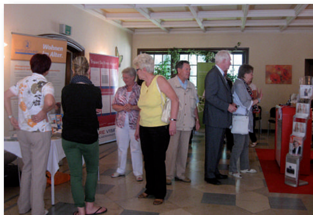
Großes Interesse fanden die Angebote der Aussteller

art steigen könnte. Die Seniorengruppen Dir 1, 3 und 5 finden ihre Ursprünge in den bereits 1957 bestehenden Pensionärsgruppen, so hießen sie damals, Polizeiinspektionen Wedding, Charlottenburg und Neukölln. Es ist möglich, dass die Gruppen Wedding und Neukölln schon früher bestanden. Die Veröffentlichung von