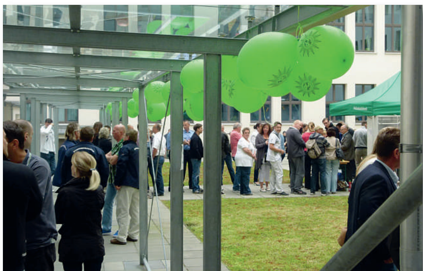
Das erste Hoffest des Personalrates ZSE – ein voller Erfolg