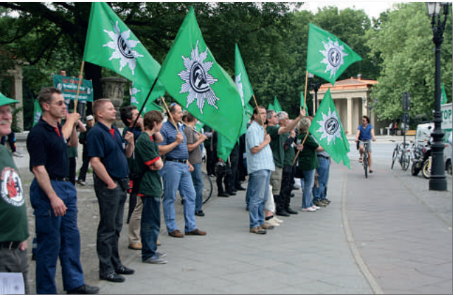
An der Siegestsäule machten die Kolleginnen und Kollegen trotz des Straßenlärms lautstark auf ihre Probleme aufmerksam.

Die GdP-Vertreter haben den Regierenden Bürgermeister aufgefordert, sein Wahlversprechen von 2006 einzuhalten. 2006 sprach er sich schriftlich der GdP gegenüber für eine Angleichung der Arbeitsbedingungen und der Besoldung bzw. Entlohnung der verschiedenen Gruppen in Berlin aus. Drei Tage später, während des 1. Mai-Aufzuges des DGB, mussten sich Klaus Wowereit und der SPD-Partei- und Fraktionsvorsitzende Michael Müller erneut den bohrenden Fragen stellen. Immer wieder hörten sie die Botschaft: „Besoldungsverhandlungen jetzt und wir sind nicht die Sparschweine der Nation.“ Am 13. Mai 2011 ging es dann zum SPD-Parteitag, die Aktionen wurden spürbar und die verantwortlichen Politiker reagierten gereizter. Will diese GdP unseren schönen Wahlkampf kaputt machen? – nein, wir bieten nur eine Plattform für die Meinungsäußerung unserer Mitglieder.