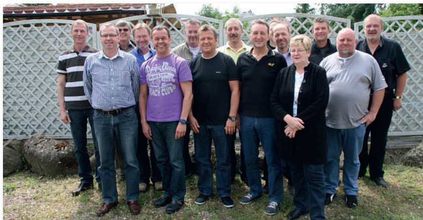
Die Kolleginnen und Kollegen wurden für die Durchführung der im Oktober beginnenden Personalratswahlen fit gemacht.

Schwerpunkte an den drei Seminartagen Anfang Juni waren die Wahlordnung, geltende Rechtsprechung und organisatorische Maßnahmen für den Wahlablauf. Aufgrund der gesunden Mischung von „Alten Hasen“ und