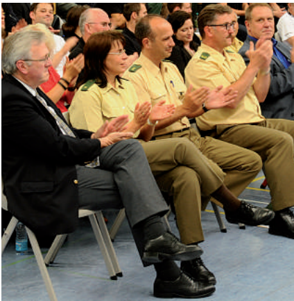
Die Polizeiführung des Saarlandes ist zahlreich vertreten.