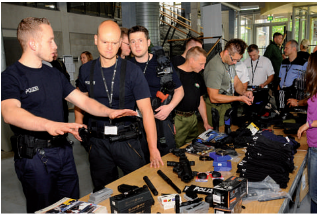
Die Fa. POLAS war ebenfalls mit einem Stand vertreten, der sich regen Zuspruchs erfreute.

kens oder auch eine Horizons erweiterung des eigenen Repertoires.