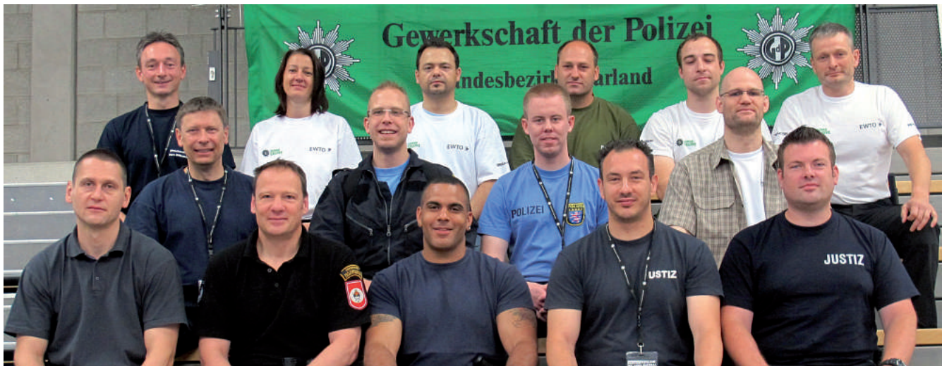
Die hessischen Teilnehmer.

„Eigensicherung ist kein Zufall“ lautete das Motto des ersten Bundesseminars für polizeispezifisches Einsatz- und Zugriffstraining, das in Zusammenarbeit der JUNGEN GRUPPE mit der EWTO (Europäische Wing-Tsun-Organisation) organisiert wurde.