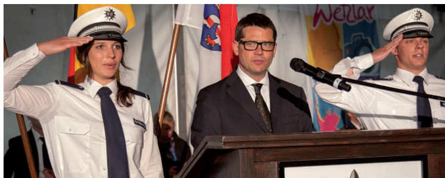
Der „heilige“ Akt. Innenminister Boris Rhein erläutert die Bedeutung des Amtseids.

Die Vereidigungszeremonie, welche eigentlich in jedem Jahr protokollarisch der des Vorjahres gleicht, gestaltete sich in diesem Jahr „modern und lebhaft!“ Das Landespolizeiorchester Hessen begrüßte die Anwesenden mit einem zackigen Marsch. Der hessische Innenmi-