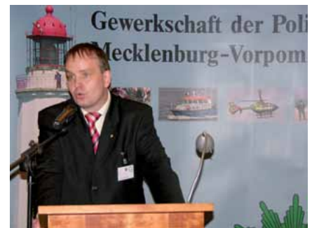
Der Landesvorstand GdP-Landesvorsitzender Christian Schumacher

ment, so Schumacher weiter, das sowohl die „klassische“ betriebliche Gesundheitsförderung als auch die Regelungen des Arbeitsschutzes beinhaltet, soll zukünftig ein Bestandteil eines Attraktivitätsprogramms für die Landespolizei werden. „Wer verlangt, dass Polizistinnen und Polizisten immer länger im Schichtdienst arbeiten, der muss auch dafür Sorge tragen, dass sie dazu in der Lage sind.“