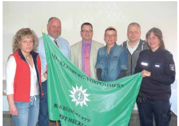
Herzlichen Glückwunsch an den neuen Kreisgruppenvorstand.