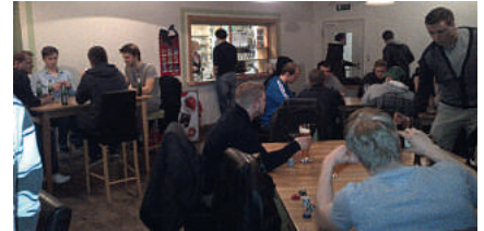
Begeisterte Gemeinschaft: Poker- und Skat-Turnier der JUNGE GRUPPE PA Nienburg

Und auch wenn wir euch nichts versprechen können, so werden wir alles dafür tun, uns unserer Verantwortung einer jungen und selbstbewussten Polizeigeneration zu stellen.“