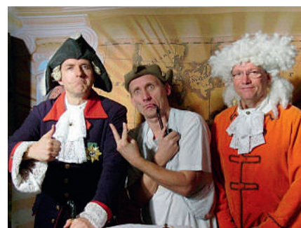
Die Akteure des Preußischen Kartoffelabends

Am Freitagabend erfolgte eine Führung durch die Altstadt von Angermünde.