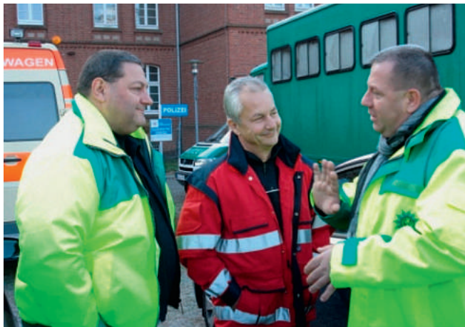
Auch der PÄD wurde nicht vergessen

Fest steht schon heute: Es war nicht die letzte Betreuungsmaßnahme. Ebenfalls