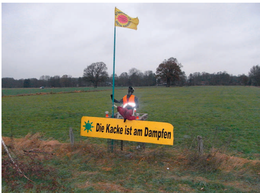
So kann man's auch ausdrücken ...

lein“ bzw. „Weiblein“ abgestellt wurde. Der Gesamteinsatzleitung dürfte es aber bekannt sein, dass die Bereitschaftspolizei nicht „gleichgeschlechtlich“ ist, was sich dann bei der Bettenberechnung hätte auswirken müssen.