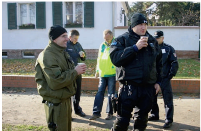
Kaffee – immer willkommen