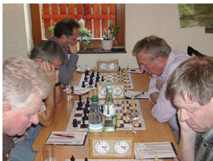
Grübel, grübel und studier ...

Vor dem Beginn der Meisterschaft im Turnierschach am 1. November 2011 mit dem Start der ersten Runde ermittelten am 31. Oktober 2011 nachmittags und am 1. November 2011 vormittags 22 Teilnehmern in sieben Runden im Schweizer-System den Sieger im Schnellschach. Beim