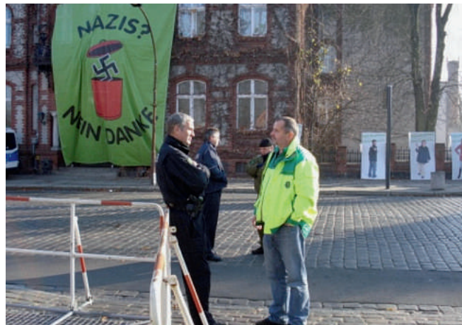
Nazis – nein danke – klares Bekenntnis

An den Einsatzabschnitten wurde unser Betreuungsteam schon mit den Worten „Wir haben euch schon erwartet“ empfangen. So kamen wir schnell ins Gespräch; über die GdP, über den Dienst, aber auch Privates kam nicht zu kurz. Betreuungseinsätze mit solchen Rückmeldungen und herzlichen Empfängen sind immer wieder eine tolle Erfahrung, machen Spaß und motivieren.