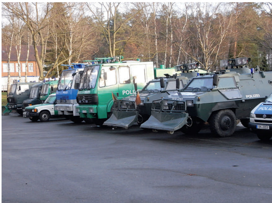
Technik aller Art und ohne Ende ...