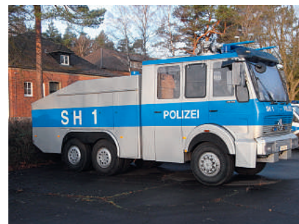
Der neue Wasserwerfer – die haben's gut, die haben wenigstens noch welche ...

ungsteam von GdP-Personalratsvertretern begleitet. Ziel war es, als Ansprechpartner für die Kollegen zu fungieren.