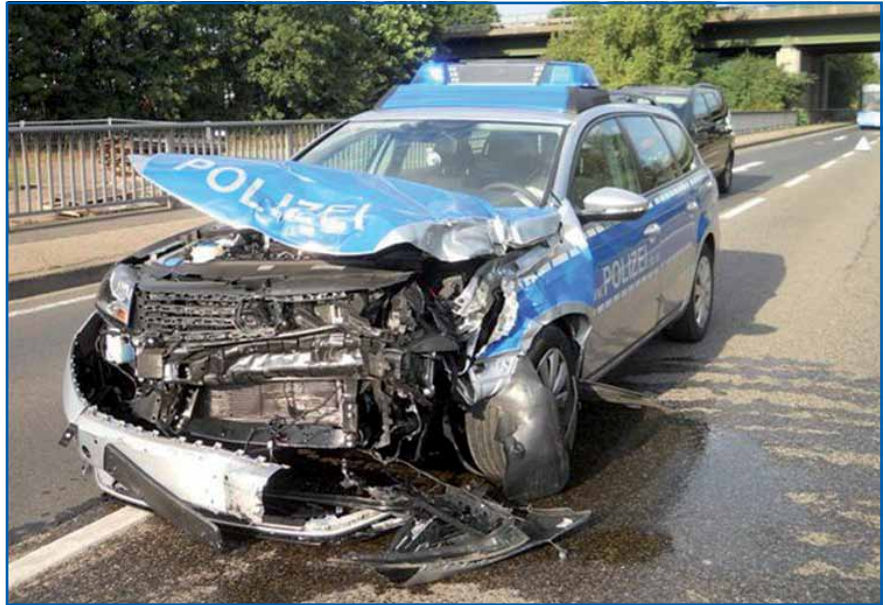
Nach Dienstunfällen ist es oft sinnvoll, frühzeitig Kontakt mit der GdP und dem Personalrat aufzunehmen.

Die Gewalt gegen Polizeibeamte nimmt zu. Wir werden beleidigt, bespuckt, geschlagen, getreten und verletzt. Zum Dank dafür werden wir nun numeriert. In Ziffern gegossenes Misstrauen der Politik gegenüber der immer in Sonntagsreden gelobten Polizei. Nicht nur alle Personalräte; Selbst die Einigungsstelle, immerhin unter Vorsitz eines Verwaltungsrichters, hatte die Kennzeichnungspflicht