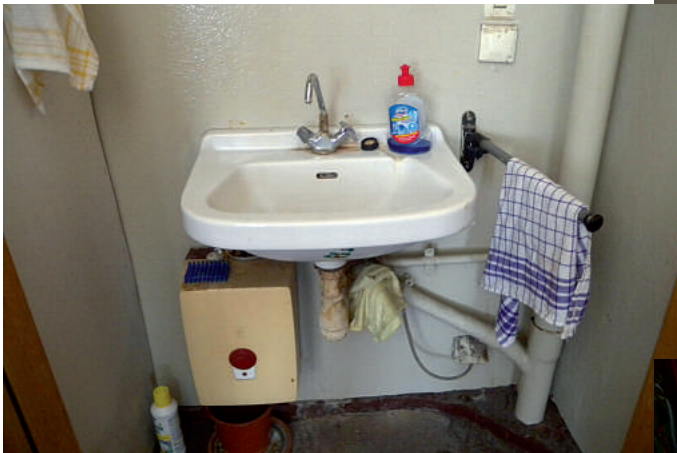
Das hat doch Charme – altertümlich und marode ...

dass das so natürlich nicht weitergehe und hier am Standort endlich saniert und neu gebaut werden muss! Abhängig machte er den Neubau nur von der Frage, wie sich die Polizeistrukturreform auf den Raumbedarfsplan auswirken wird. Also dass „man“ ggf. neu planen muss. Meinem Kenntnisstand nach ist auch dies passiert – aber entkernt, saniert und neu gebaut wird hier nix!!!