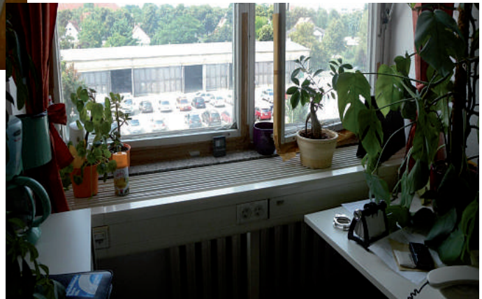
Fensterabdichtung mal anders. Haben wir doch gelernt – Improvisation und Selbsthilfe ist alles.