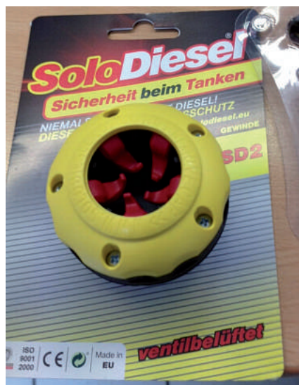
Und so sieht das Teil, dank Smartphone abgelichtet, aus.

Man stelle sich vor, jedes Fahrzeug hätte von Anfang an dieses Teil drin, da wäre einiges an Frust und Ärger erspart geblieben. Von den Kosten mal ganz abgesehen. Übrigens macht die Firma auch Flotten-Angebote für Unternehmen. Also immer noch eine nachdenkenswert Sache, auch wenn die Fälle zurückgegangen sind. Im Rahmen des „innerbetrieblichen Vorschlagswesens“ ist jedenfalls mein Vorschlag: Ausstattung aller Fahrzeuge! Hilfsweise kann man ja auch der Fahrzeugindustrie vorschlagen, derartige