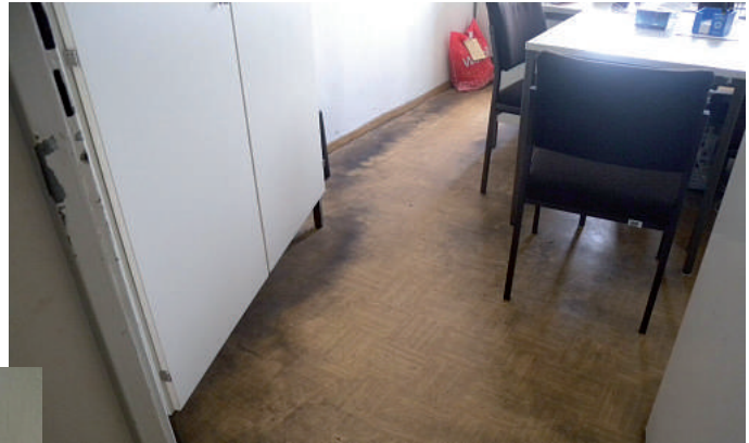
... echt wohnlich ...

Auf der Personalversammlung am 16. 7. 2012 habe ich die Situation beschrieben und die PD Nord wie auch das