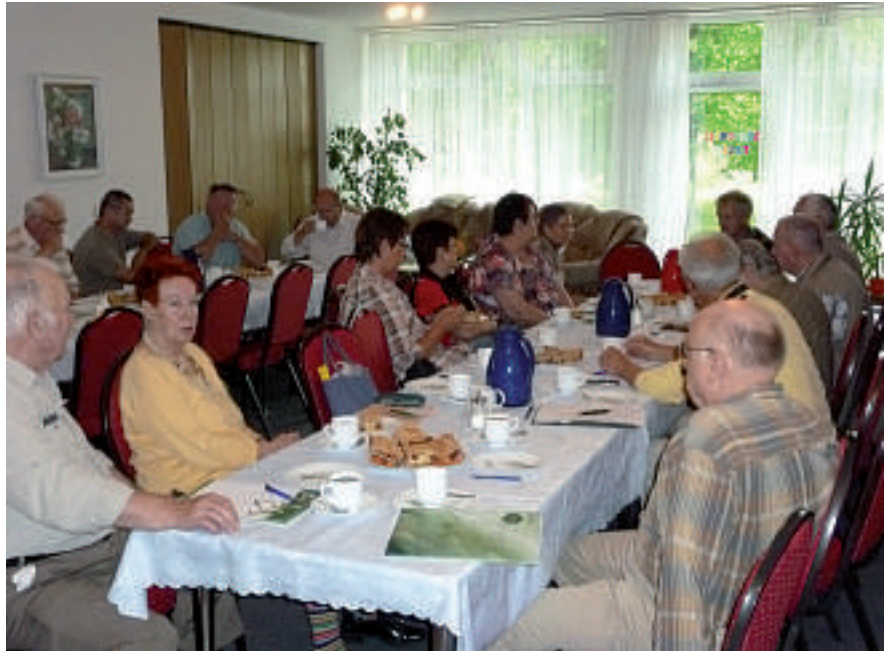
Mitgliederversammlung der Seniorengruppe der GdP-Kreisgruppe Rostock