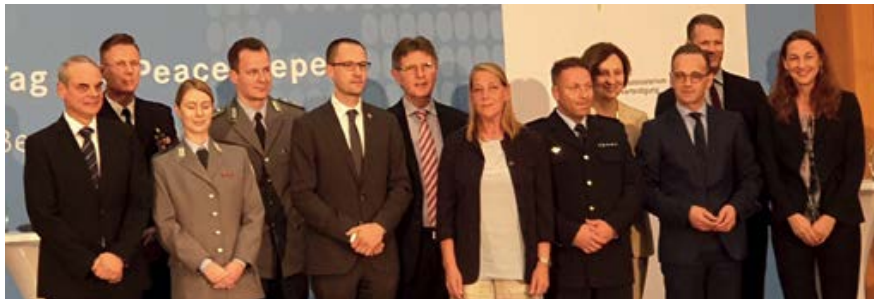
Alle Geehrten mit Außenminister Heiko Maas.