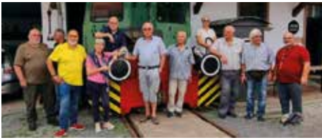
Ausflug des Seniorenverbundes