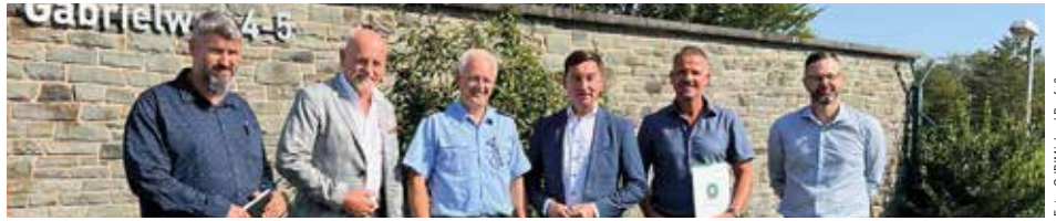
Vor-Ort-Termin im AFZ Swisttal