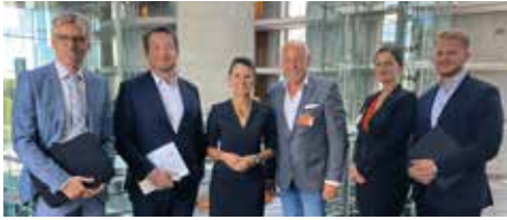
Politischer Termin im Paul-Löbe-Haus