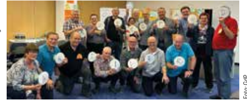
Seminar „Seniorenarbeit aktiv gestalten“