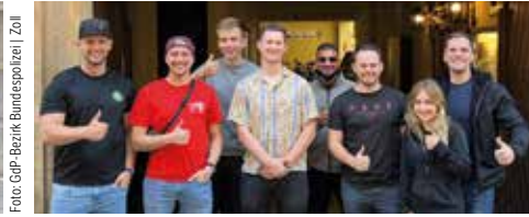
Junge-Gruppe-Nachwuchsseminar in Bamberg