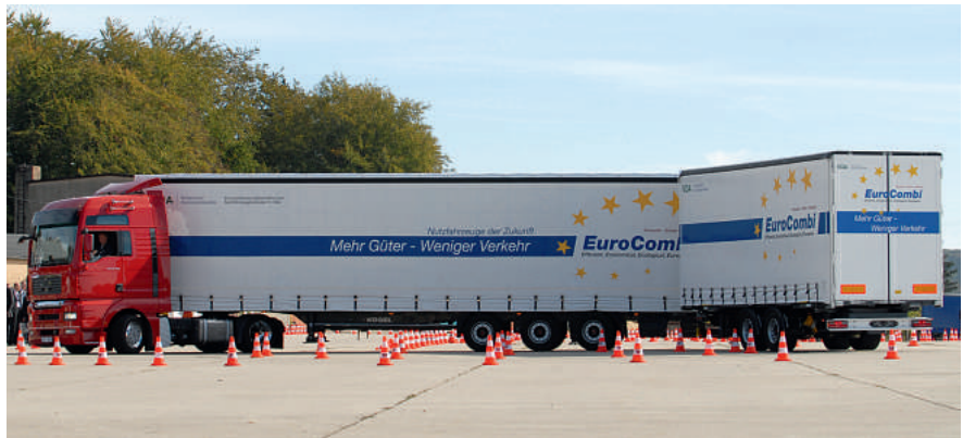
Die so genannten Giga-Liner werden möglicherweise bald auch auf schleswig-holsteinischen Straßen zu sehen sein.

Das Hamburger Abendblatt meldet am 6. September, dass im Land bereits einige Riesen-Lastwagen mit Ausnahmegenehmigung für bestimmte Routen legal auf Tour sind. Ein dänisches Unternehmen befördert etwa auf der Strecke Kaltenkirchen–Odense Blumen, ein anderes fährt zwischen Neumünster und Stapelfeld im Kreis Stormarn. Die Polizei fürchtet ein höheres Unfallrisiko. „Zwar