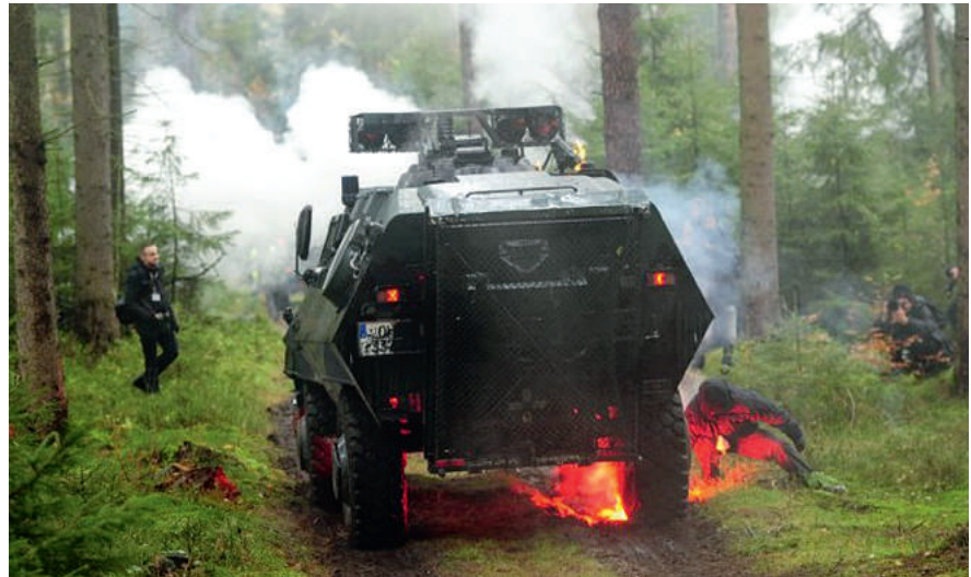
Auch bei Demonstrationen scheuen Autonome nicht davor zurück, das Leben von Polizeibeamten zu gefährden.